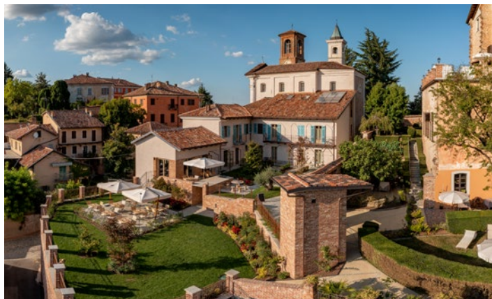
Sunstar Hotel Pontresina

Haben Sie dem Hotel Castello di Villa noch keinen Besuch abgestattet? Dann ist das Sommerfest die ideale Gelegenheit, denn der organisierte Bustransfer von/bis Lugano SBB wartet bereits auf Sie. Freunde und Bekannte sind ebenfalls herzlich willkommen.