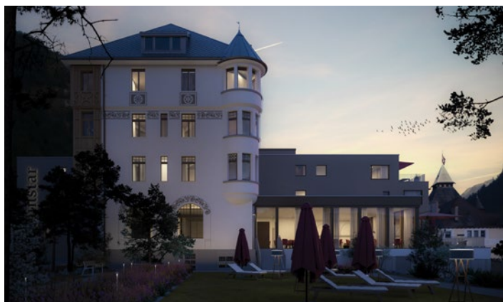
Sunstar Hotel Pontresina

Aufgrund von baulichen Verzögerungen des neuen Sunstar Hotels in Pontresina mussten die Privilège Tage vom Frühling 2024 in den Herbst verschoben werden. Das neue Direktions-Team Noémie Ruckstuhl und Eva Leitner gestalten für Sie ein abwechslungsreiches Programm. Weitere Informationen folgen online – oder rufen Sie den Mitglieder-Service an.