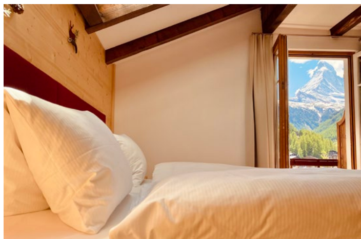
Hotel Garni Capricorn, Zermatt

Zermatt ist ein neues Mitglied unserer Partnerhotelfamilie. Mit dem Hotel Garni Capricorn haben wir einen weiteren perfekten Partner in den Walliser Bergen gefunden. Denn das Hotel bietet nebst der idealen Lage zudem moderne Zimmer (teils mit Blick aufs Matterhorn) und eine neue Wellness Oase.