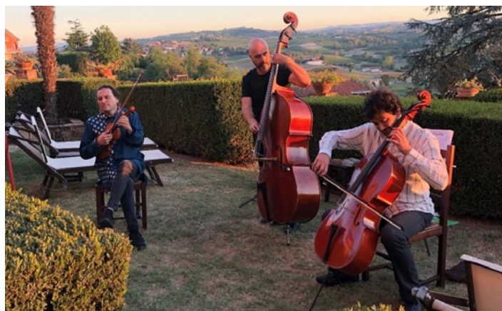
Vivaldi vom Feinsten mit dem Trio «Gli Archimedi» in toller Atmosphäre