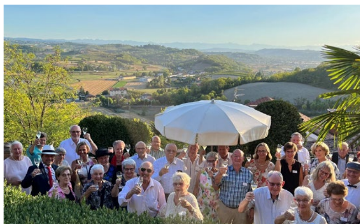
... die 2. Gruppe stand in nichts nach...