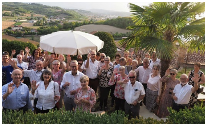
Fröhliche Stimmung in mediterranem Ambiente während des Galaabends (1. Gruppe)

Über das nächste Sommerfest informieren wir in der Privilège Revue (Frühjahr 2023).