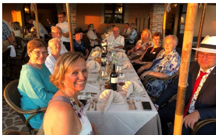
Gut gelaunte, erwartungsfreudige Gäste am Galaabend